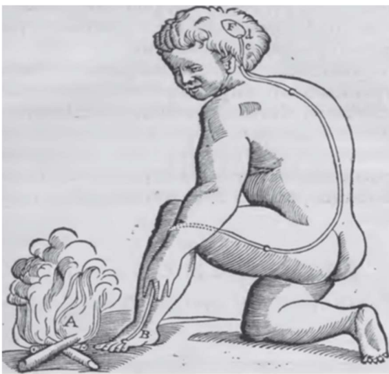
Figura 1. Representação do sistema da dor segundo Descartes

Partículas de calor (A) activam um local da pele (B) ligado por uma fina linha (cc) a uma válvula no cérebro (de) onde esta actividade abre a válvula, permitindo os espíritos animais fluir de uma cavidade (F) para os músculos fazendo-os recuar do estímulo, voltar a cabeça e os olhos para a parte do corpo afectada, mover a mão e virar o corpo de forma protectora.